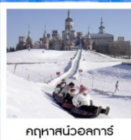
ฤดูหาลสนวออลการ