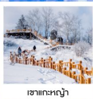
เซาเกาะหญ่า