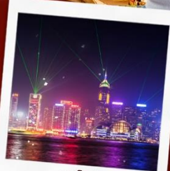
ชมโชว์ SYMPHONY OF LIGHT