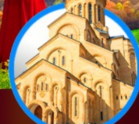
โบสถ์กรินดี เมืองทบิลีซี