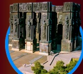
อนุสาวรีย์ประวัติศาสตร์