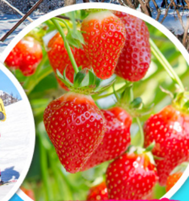
ไรสตรอว์เบอร์รี่