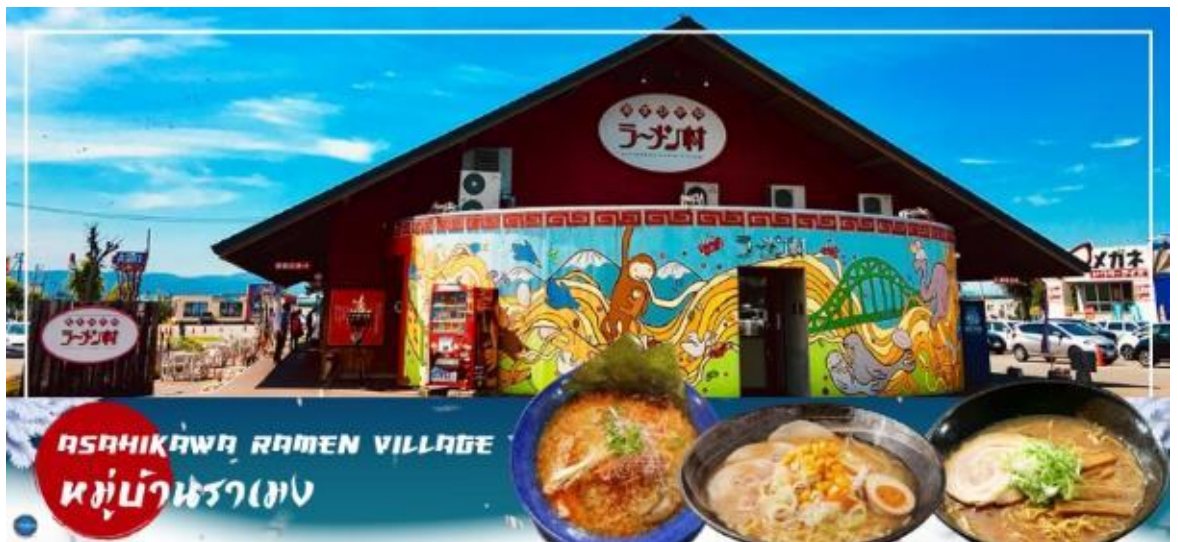
ASAHIKAWA RAMEN VILLAGE หมู่บ้านรามเอน

อิสระรับประทานอาหารกลางวัน ณ หมู่บ้านรามเอน