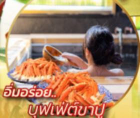
อิมมอร้อย... บุฟเฟ่ต์ชาบู