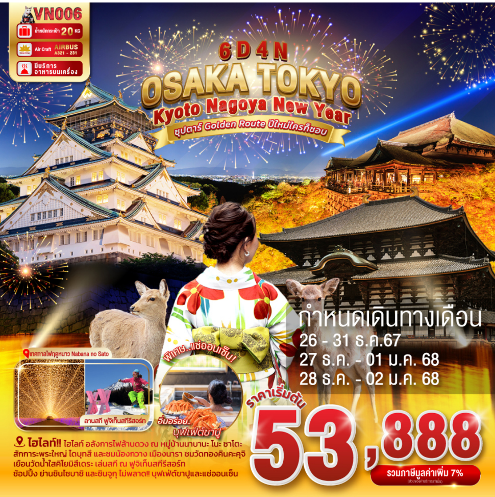
เทศกาลไฟฤดูหนาว Nabana no Sato