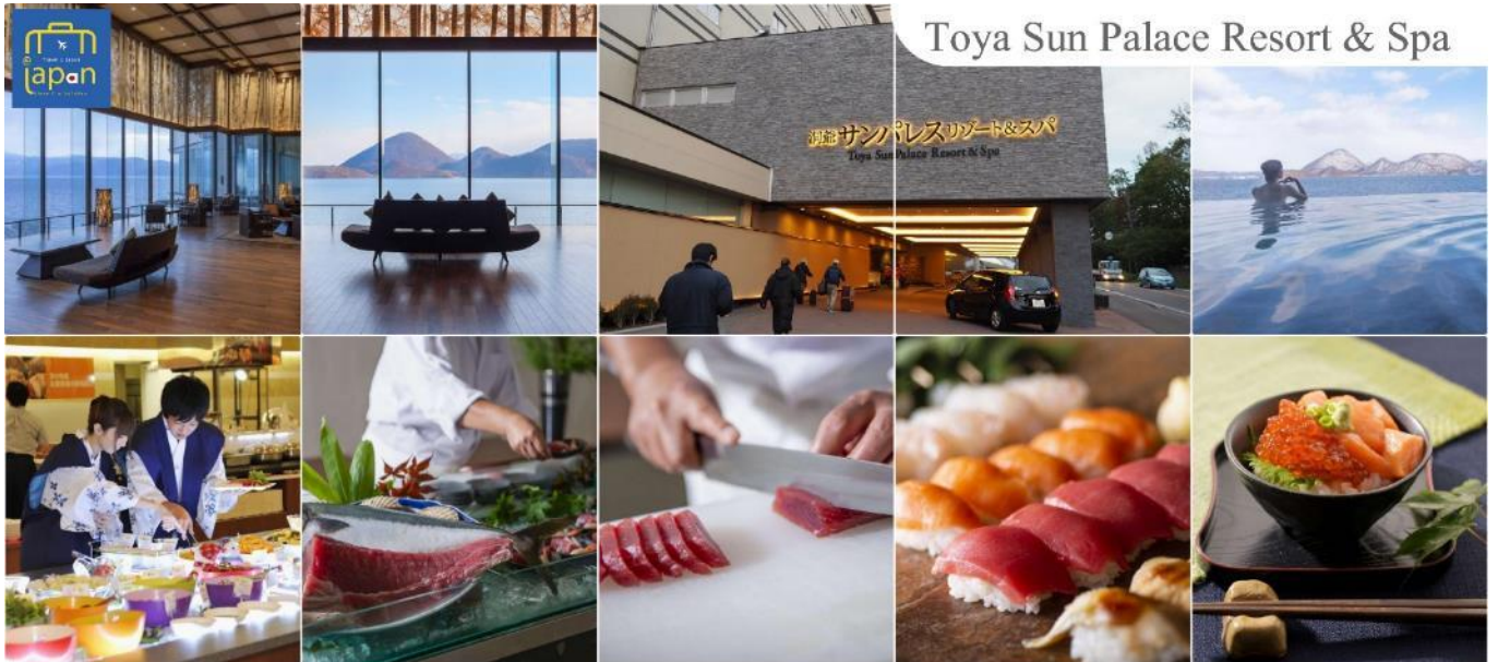
Toya Sun Palace Resort & Spa

ที่พัก TOYA SUN PALACE RESORT & SPA หรือเทียบเท่าระดับเดียวกัน