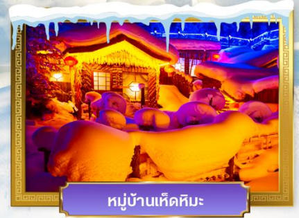
หมู่บ้านหิมะหิมะ

เดินทางโดย : สายการบินโซน่าเซาเทิร์นแอร์ไลน์