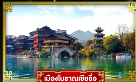
เมืองโบราณเซี่ยซือ