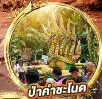
ปราสาทคำชะโนด