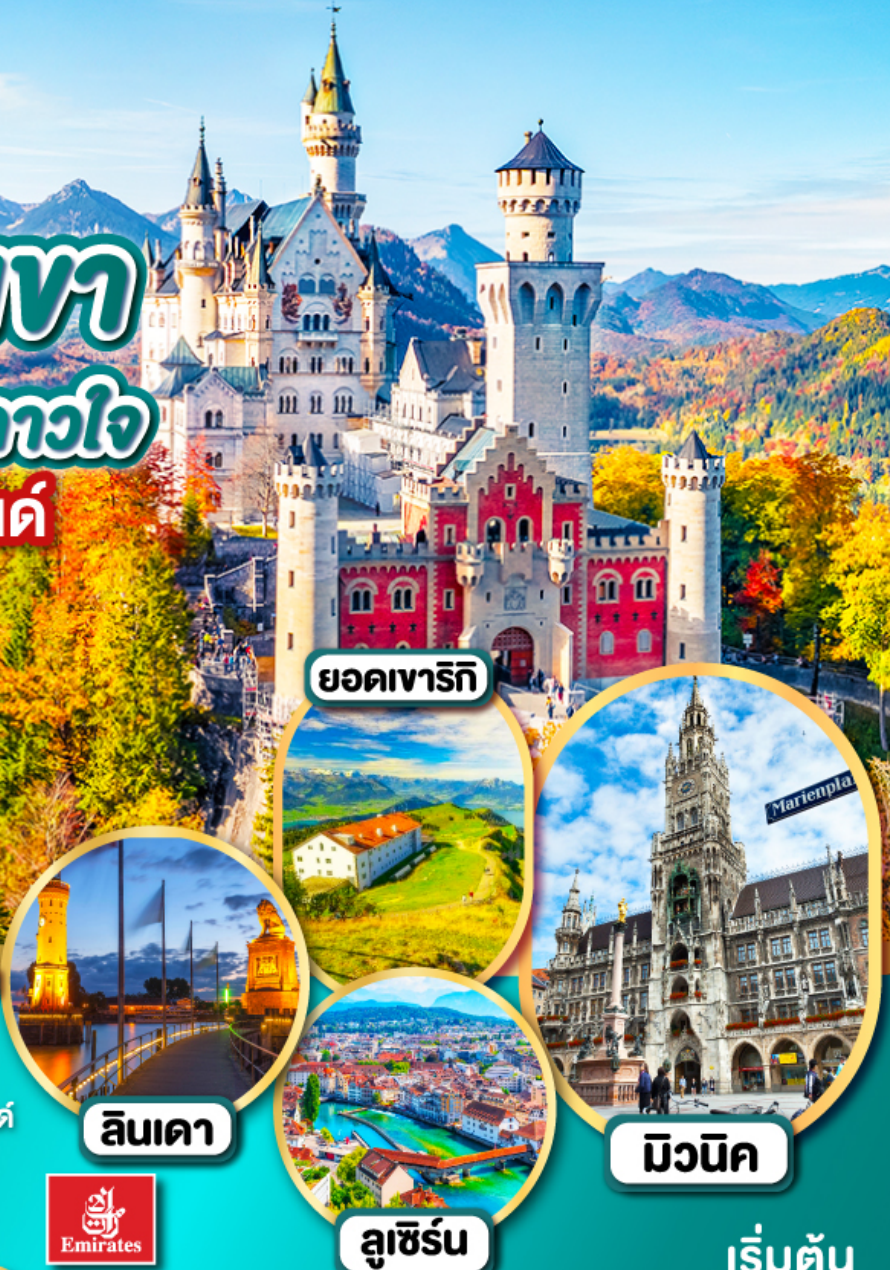
ยอดเขารีกี