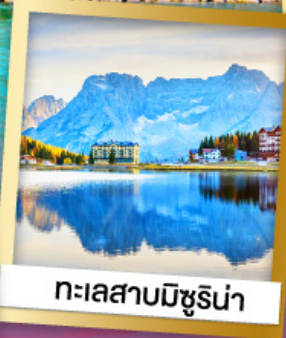
ทะเลสาบมิซูรีน่า