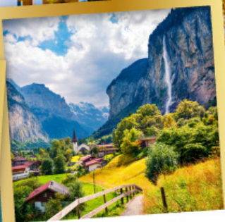
เลาเทอร์บรุนเนิน