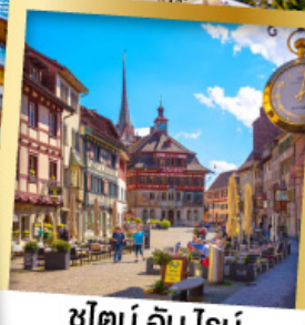
ชไตน์ อัม โรน์