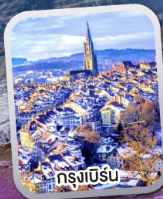
กรุงเบิร์น