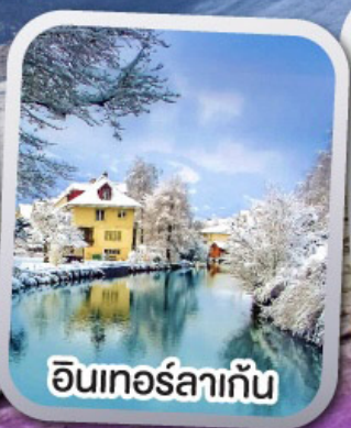
อินเทอร์ลาเก้น