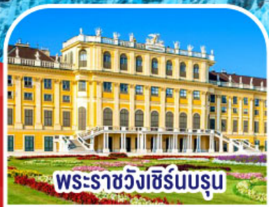
พระราชวังเชิร์นบรุน