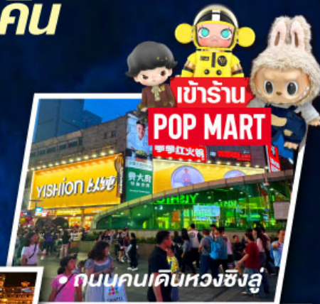
• ถนนคนเดินทองซิงหลู