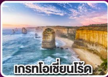
เกรทโอเชียนโรด