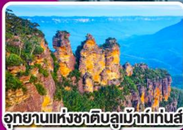
อุทยานแห่งชาติบลูเมาท์เทนส์