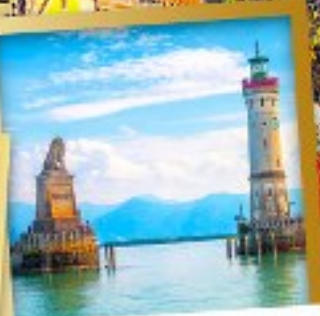
เมืองลินเคา