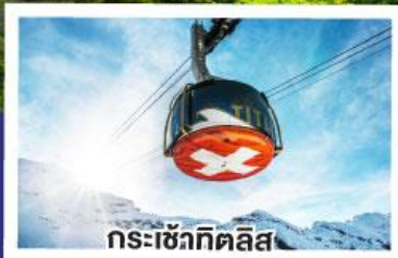
กระเช้ากิตติส