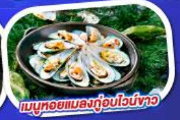
เมนูหอยแมลงภู่อุปไวน์ขาว