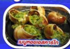
เมนูหอยออสการ์โท

ทานอาหาร ณ ภัตตาคารบนหอไอเฟล พร้อมชมวิวแสนโรแมนติก เมนูหอยแมลงภู่อุปไวน์ขาว