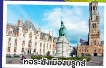
หอรบั้งเมืองบรูคส์