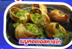
เมนูหอยแอสคาร์โท