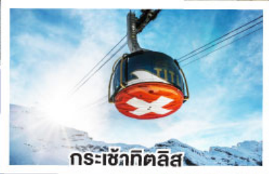
กระเช้าทิลิส