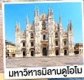
มหาวิหารมิลานดูโอโม

เมนูพิเศษ! หอยเอสคาโก้ อาหารไทย, ฟองดูซีส