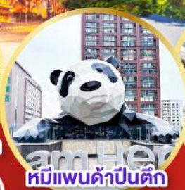
หมีแพนด้าปิ่นตึก