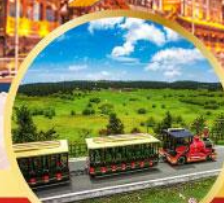
อุทยานเขานางฟ้า