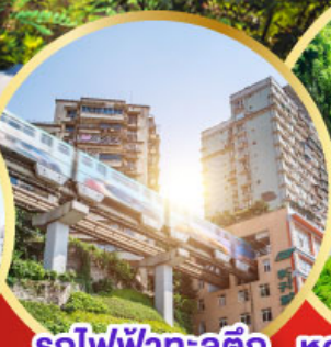
รถไฟฟ้าทะลุติ๊ก หลุมฟ้าสะพานสวรรค์