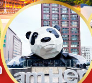
หมีแพนด้าปิ่นตึก