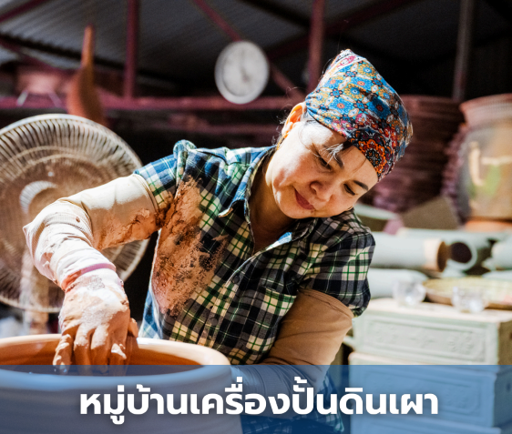
หมู่บ้านเครื่องปั้นดินเผา