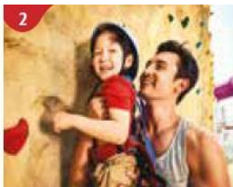
2 Rock Climbing Wall Challenge yourself on our mountainous rock climbing wall.