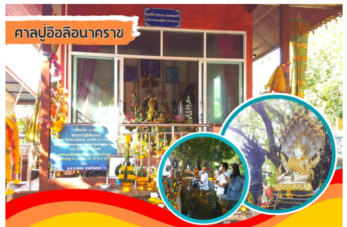
ศาลปู่อ้อลือนาคราช

เรื่องราวคือพระอ้อลือถูกพระยานาคราชจับตัวไว้ พร้อมกับสาปให้พระอ้อลือราชากลายร่างเป็นนาค เผื่ออยู่ในบึงโขงหลงชั่วนิรันดร์ จนกว่าจะมีเมืองเกิดใหม่ในดินแดนแห่งนี้ จึงจะล้างคำสาปของพระยานาคราชได้ ซึ่งชาวบ้านมักจะบนบานศาลกล่าวหรือขอพรจากท่านให้แคล้วคลาดปลอดภัยทุกครั้งทีออกไปหาปลาในบึงและเรื่องหน้าที่การงานเพื่อให้สมปรารถนา