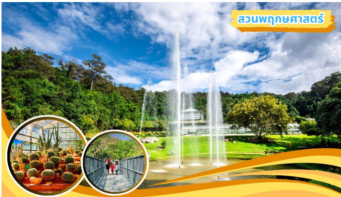
สวนพฤกษศาสตร์