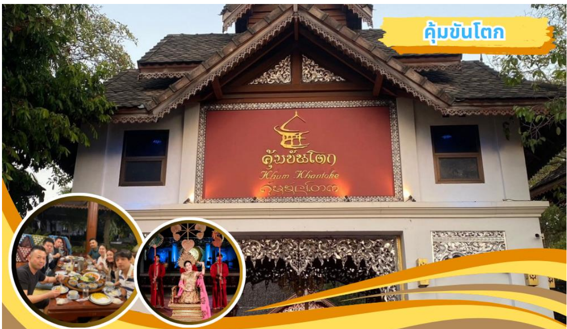
คุ่มขันโตก

นำคณะเดินทางไปรับประทานอาหารค่ำ ๑๐ อาหารค่ำ ณ คุ่มขันโตก(๖) พร้อมชมการแสดงพื้นเมืองลานนา หลังอาหารนำคณะเดินทางกลับที่พัก อิสระพักผ่อนตามอัธยาศัย