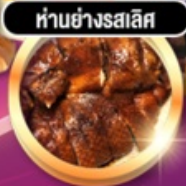
हांอย่างรสเลิศ