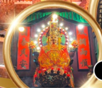
ขอพรซื้อขายอสังหาริมทรัพย์