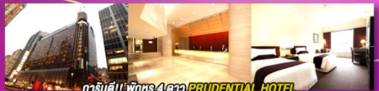
ทาร์นตี!! พักหรู 4 ดาว PRUDENTIAL HOTEL ติดถนนนาราน ย่านช้อปปิ้งจิมซาจู้