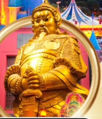
วัดแชกงหมิว