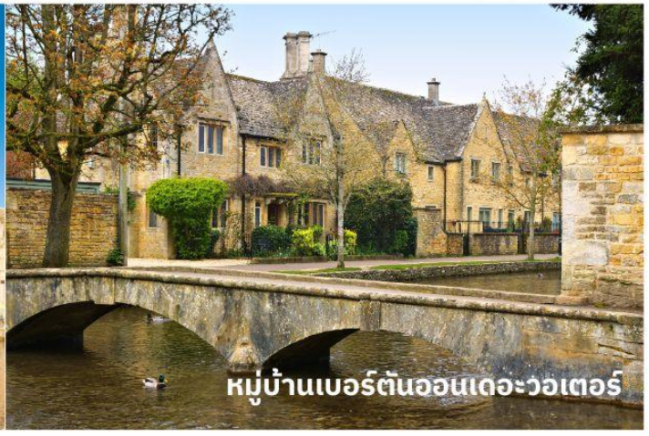
หมู่บ้านเบอร์ตันออนเดอะวอเทอร์