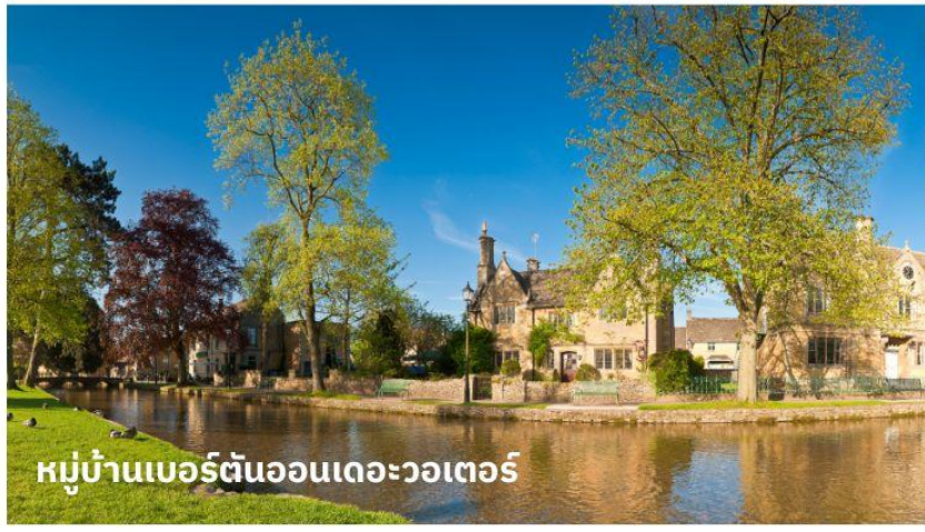
หมู่บ้านเบอร์ตันออนเดอะวอเทอร์