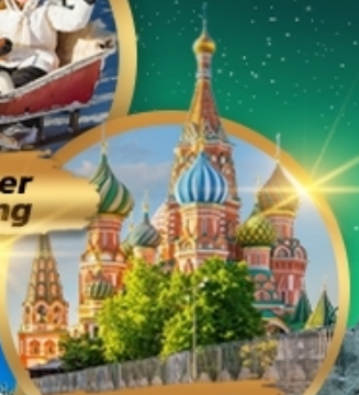
St. Basil's Cathedral