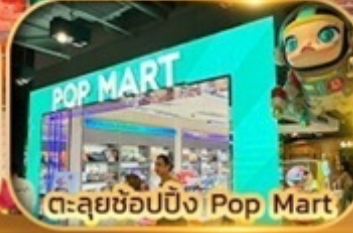
ตะลุยช้อปปิ้ง Pop Mart