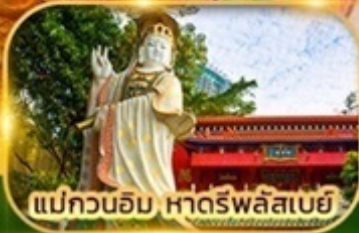
แม่กวนอิม หาดรีพลัสเบย์