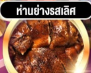
ห่านย่างรสเลิศ