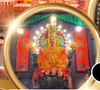
ขอพรซื้อขายอสังหาริมทรัพย์