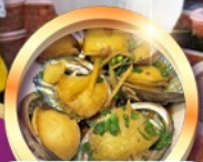
เมนูซีฟู้ดลิ้นมดุน