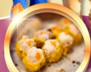
ติ่มซำต้นตำรับ