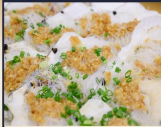
หอยเชลล์อบวุ้นเส้น