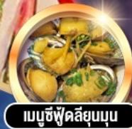
เมนูซีฟู้ดลิ้นยุบนุ่ม