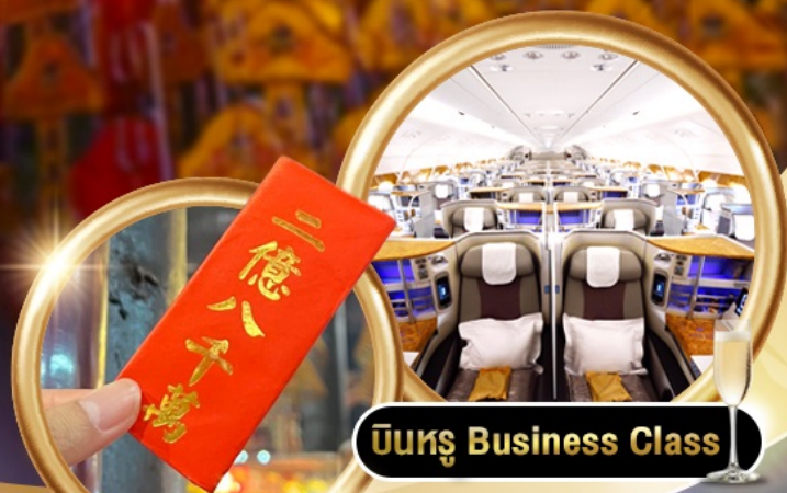
บินหรู Business Class