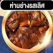
ห่านย่างรสเลิศ