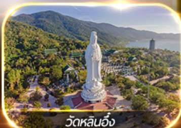
วัดหลินอึ้ง