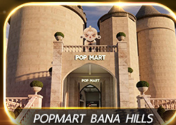
POPMART BANA HILLS

สัมพัสความงามหมู่บ้านฝรั่งเศสที่บานาฮิลล์ ซอปปิง POPMART