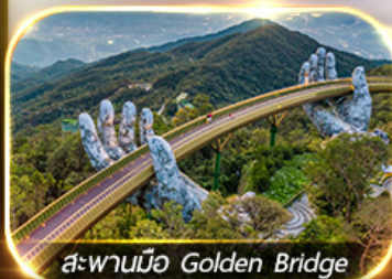
สะพานมือ Golden Bridge