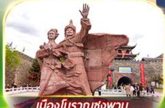
เมืองโบราณซ่งพาน