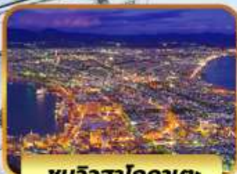
ชมวิวดาวเหนือ