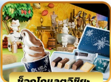
ช็อกโกแลตชิชะ