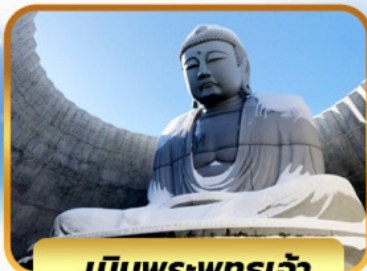
เป็นพระพุทธรเจ้า