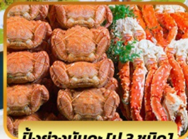
บึงย่างนินตะ [ปู 3 ชนิด]