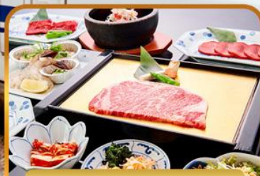
บียง่างร้านดัง ROKKASEN