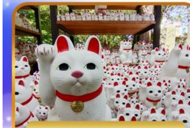
วัดโทโทคุจิ