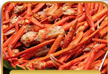
บุฟเฟ่ต์ขาปูยักษ์

ฟรีเดย์โตเกียว 1 วัน อิสระ ช้อปปิ้งหรือช้อปปิ้งทัวร์เสริมดสนีย์แลนด์ 27 ธ.ค. – 01 ม.ค. 2568