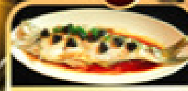
ปลาประดาน้ำ