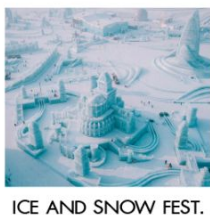
ICE AND SNOW FEST.

คฤหาสน์วอลการ์ (ฟรีเล่น Snow Tubing) โบสถ์เซนต์นิโคลัส / มู่ตันเจียง / ชมแสงสีกลางคืนถนนสายยูนิเจีย เขาแกะหญา / เขาปังดุย / ภาพเขียนสี ICE AND SNOW โบสถ์เซินโซเฟีย / เกาะพระอาทิตย์ / เทศกาลแกะสลักน้ำแข็ง