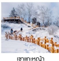
เขาแกะหญา

ฟรี!! ...ถุงมือ ผ้าพันคอ หมวก ทำนลละ 1 ชุด