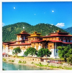
พูนาคาซอง