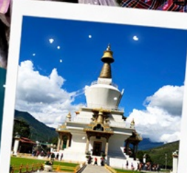
อนุสรณ์สถานทิมพู