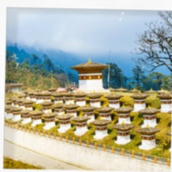
จุดชมวิวโตซูลา

พิชิตยอดเขาวัดทักซัง พลังศรัทธาของชาวพุทธ เที่ยวครบ เมืองพาโร ทิมพู พูนาคา