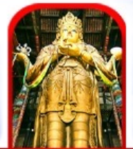
วัดกานดา