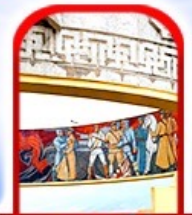
อนุสาวรีย์ โซซาน