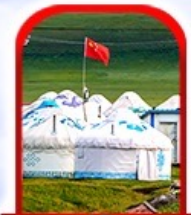
หมู่บ้าน พื้นเมือง