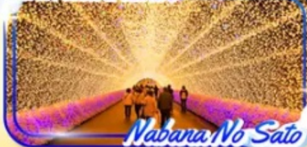
Nabana No Sato