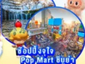
ช้อปปิ้งจ๊อ Pop Mart ชิบูย่า