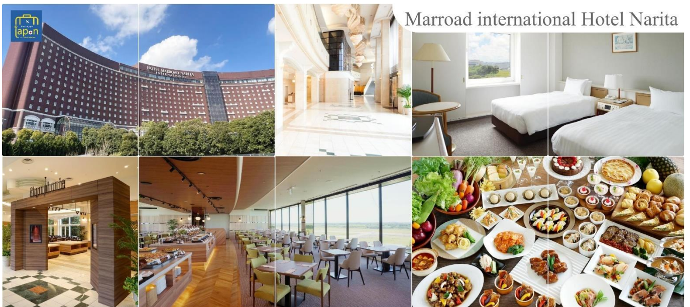
Marroad international Hotel Narita

MARROAD INTERNATIONAL HOTEL NARITA หรือเทียบเท่าระดับเดียวกัน