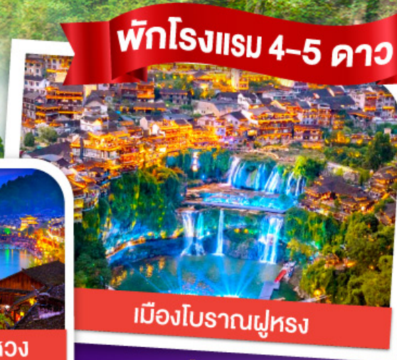
พักโรงแรม 4-5 ดาว