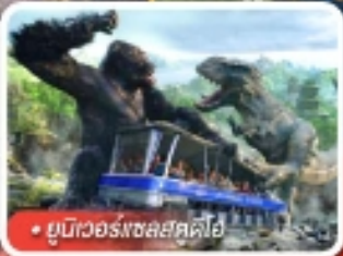
ยูนิเวอร์สอลสตูดิโอ