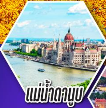
แม่น้ำดานูบ