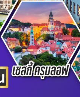
เซสกีครุมลอฟ