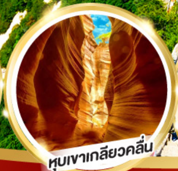
หุบเขาเกลียวคลื่น