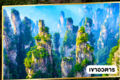
เวาอวดาร