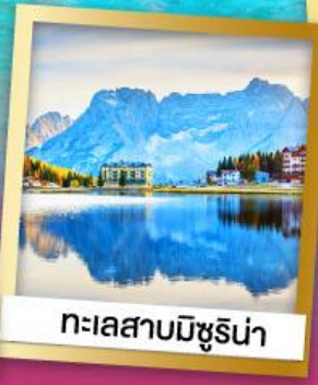
ทะเลสาบมิซูริน่า