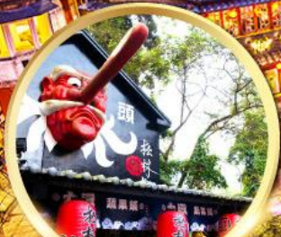
หมู่บ้านปศาจซีโกว