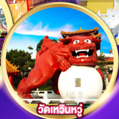
วัดเหวินหวู่