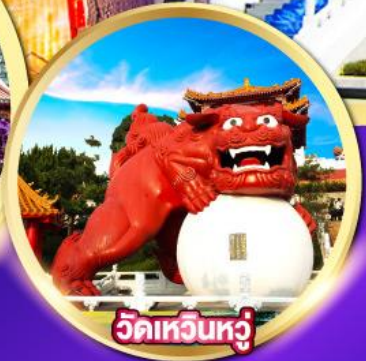
วัดเหวินหู่

โรงละครไทจง-หมู่บ้านปศาจซีโกว วัดเหวินหู่, วัดหลงซาน-ล่องเรือทะเลสาบสุริยันจันทรา พิพิธภัณฑ์แห่งชาติกู้กง-ถนนโบราณจิวเฟิ่น ช้อปปิ้งตลาดไทจง, ตลาดซีเหมินติง, Gloria Outlet