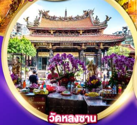
วัดหลงซาน