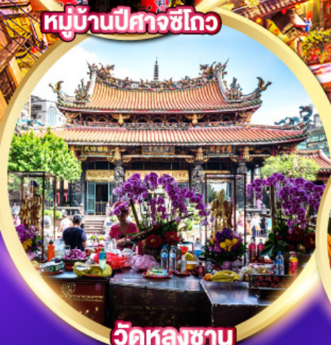
วัดหลงซาน