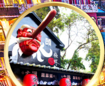
หมู่บ้านปัสจางชิโก