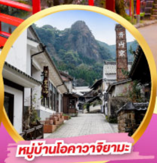
หมู่บ้านโอคาว่าจิยามะ