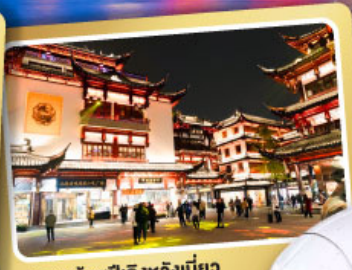
ตลาดร้อยปีเฉิงหวงเหมียว